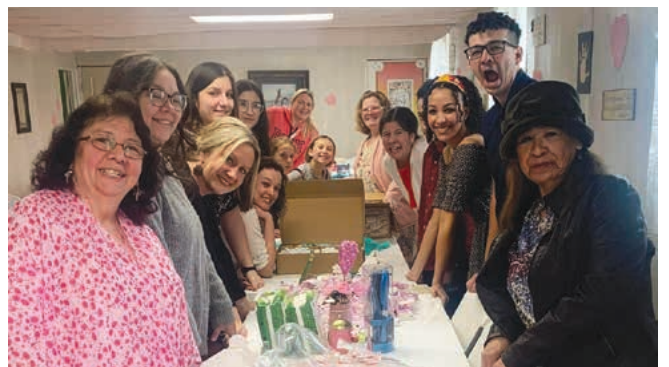
Saginaw: Recopilación de materiales para Outreach Giving Tree