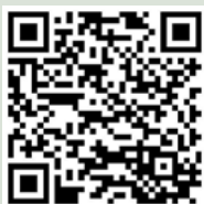
Recursos para seminarios web

Inscríbese en https://my.artioscollege.org/es/courses